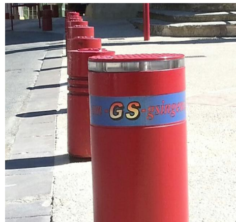
Combinaison de bornes : Automatique et Semi automatique (photo non contractuelle)

Les données ci dessus sont strictement indicatives et, peuvent varier en fonction de nos fabrications.