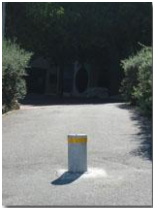
Borne semi automatique (photo non contractuelle)