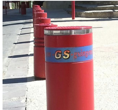
Combinaison de bornes : Automatique et Semi automatique (photo non contractuelle)

Les données ci dessus sont strictement indicatives et, peuvent varier en fonction de nos fabrications.